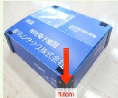
重量30kgまでの機器なら 作業台 としても利用可。

折りたたみ時の高さは 170mm でかさばりません。 (組立時の半分以下 440mm→170mm)