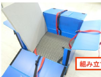
組み立てイメージ

折りたたんだ状態から 組み立て～収納 までが簡単にできます。 バンドも色が異なり視覚的に判別でき、迷うことなく収納できます。 箱の内蓋には収納手順も印字してあるので安心です。