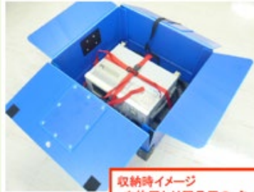
収納時イメージ ・本体用と付属品用のバンドの色を区別