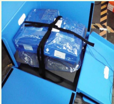
オムニエースRA2300を梱包した例