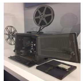
1968年創業当時の映写機

本社：東京都江東区有明3-7-18 有明セントラルタワー8階 従業員数：260名（2018年4月現在） URL： http://www.avc.co.jp/